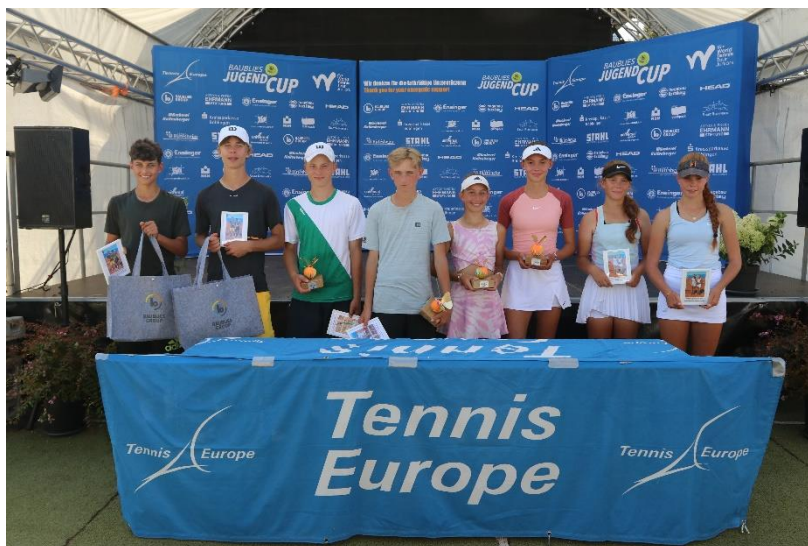
Award ceremony 2023

Before, during and after the tournament own press coverage by homepage, tournament journal and press review. During the tournament additional publications in local media (press, TV and radio).