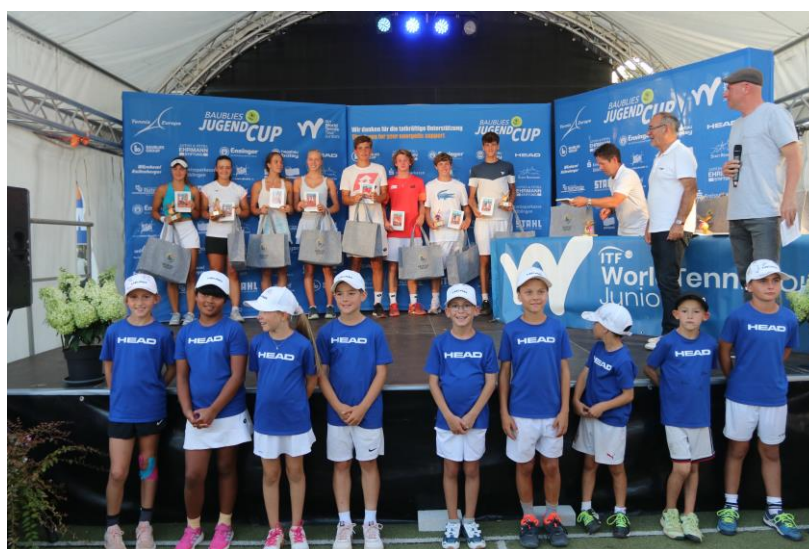
award ceremony 2023

Before, during and after the tournament own press coverage by homepage, tournament journal and press review. During the tournament additional publications in local media (press, TV and radio).